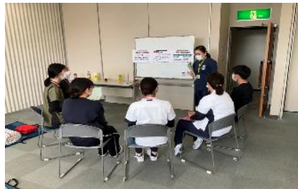
岡山旭東病院 ICLSコース

★NPO救命おかやまではICLSコース開催をサポートすることも一つの大きな役割と考えています。お問合せは事務局までお願いいたします。