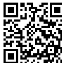
【講演会・懇親会・総会出欠用 QR コード】

※総会・講演会・懇親会の参加お申込みは、NPO救命おかやまHPから、又は、上記QRコードよりお申込下さい。