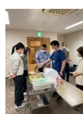
赤穂市民病院 ICLS コース